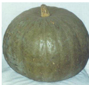
Гарбуз «Кавбуз Здоров'яга»