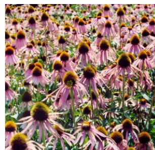
Ехінацея пурпурна «Поліська красуня»

На малюнках представлені розроблені за новою технологією А.І. Потопальським з колегами резистентні до дії шкідливих факторів зовнішнього середовища нові сорти рослин, які затверджені Держсортінспекцією України, більшість ще вивчаються.