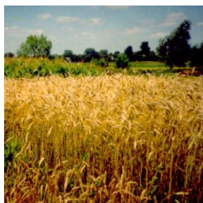
Озиме жито «Древлянське»

Його досягнення в селекції, далекій від медицини справи, вражають. Завдяки розробленому за його керівництва способу зміни структури молекул - носіїв спадкової інформації ДНК і РНК - створено технологію одержання нових форм рослин з програмованими господарськими цінними ознаками. Їх широке використання дає значний економічний і соціальний ефект, зокрема в оздоровленні довкілля, збиранні високих врожаїв на засолених і збіднених азотом ґрунтах, а також під час гідропонного вирощування з використанням морської води без її опріснення.