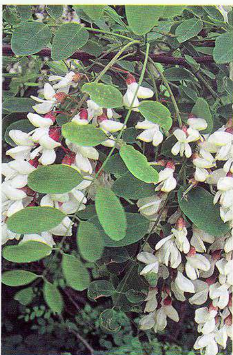
Акація біла (Робінія звичайна)

дендропарку «Перемога» в с. Ходаки Коростенського району вирощено багато саджанців і сіянців цінних дерев і кущів, які дарувалися мешканцям регіону, і будуть вони основою майбутніх Садів Перемоги, ініціативно вирощених в Україні, згідно завдань Міжнародної програми Сади Перемоги (сайт програми: https://sadyperemohy.org/ ).