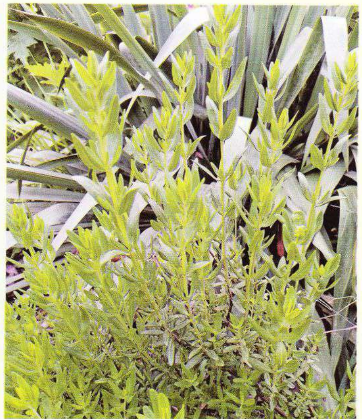
Початок травня 2024 р. Молоді пагони гісопу