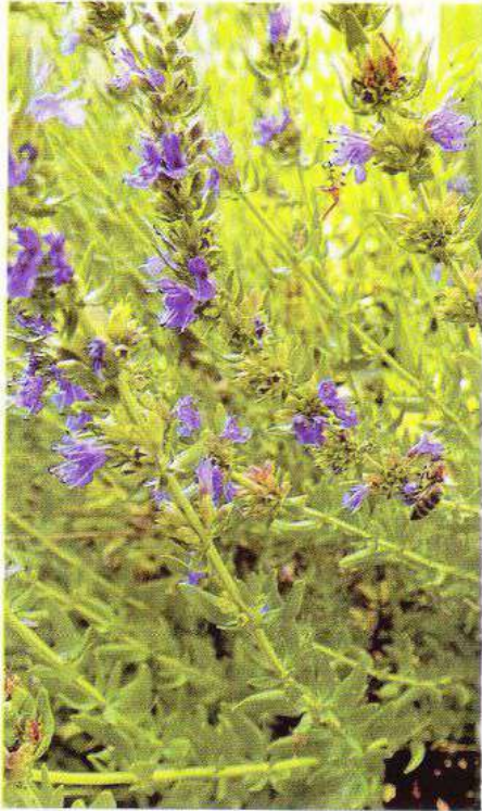
Цвіте духмянний гісоп