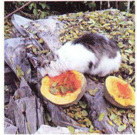
Навіть коти оцінили смак кавбуза

протягом дня. Курс лікування – 27 днів. Перерва один тиждень, потім проводять ще 1–2 курси.