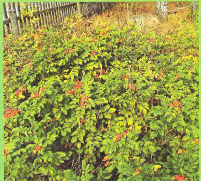
Плодоносні зарослі троянди або шипшини зморшкуватої при в'їзді у дендропарк «Перемога» с. Ходаки