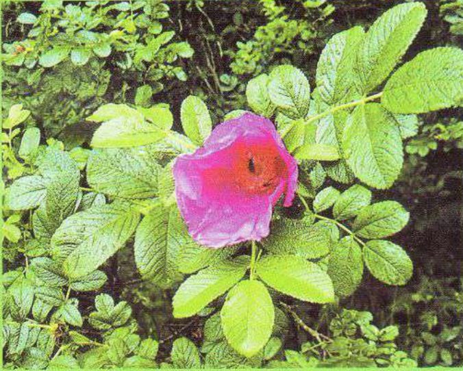
Квітка троянди або шипшини зморшкуватої в дендропарку «Перемога» с. Ходаки