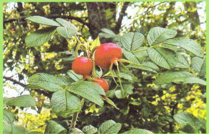
Плоди троянди або шипшини зморшкуватої в дендропарку «Перемога» с. Ходаки