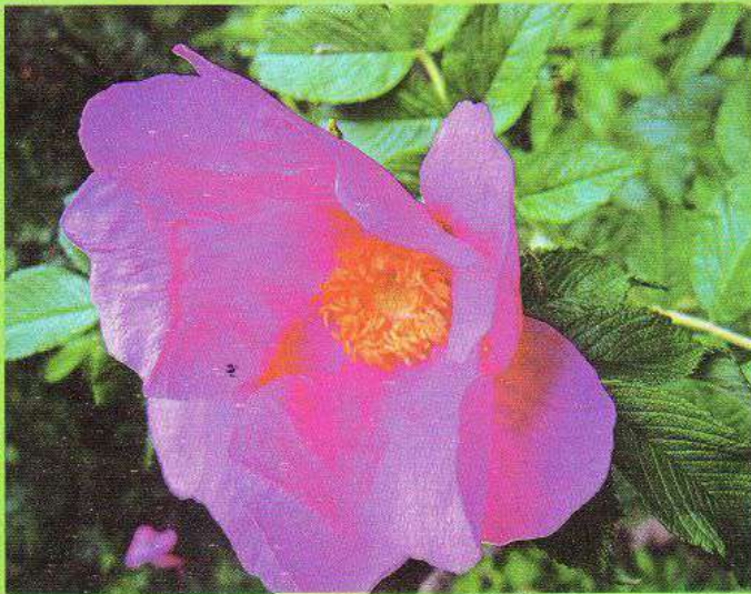
Квітка троянди або шипшини зморшкуватої