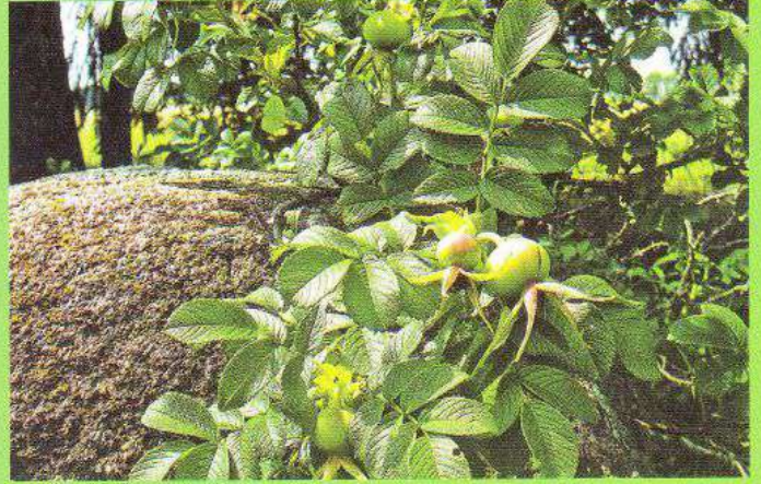
Зав'язі плодів на кущі троянди або шипшини зморшкуватої над поліським каменем-валуном у дендропарку «Перемога» с. Ходаки