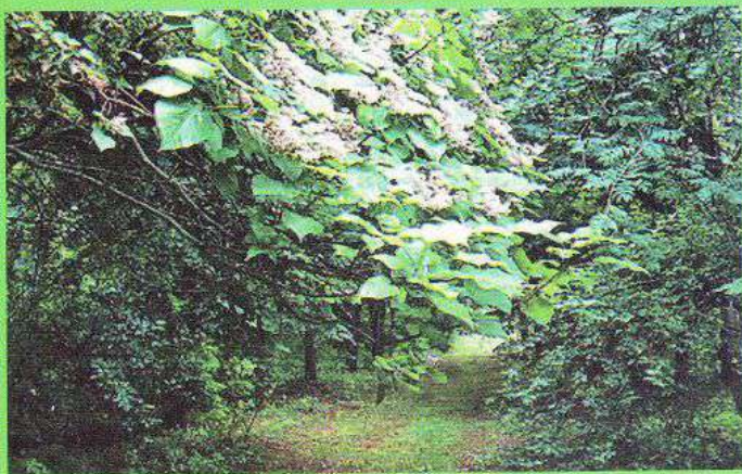
7. Весна, цвіте катальпа над доріжкою – зачарована краса дендропарку.