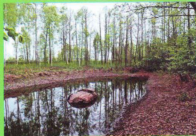
9. Осінь, камінь закоханих і вічної любові – зачарована краса дендропарку.