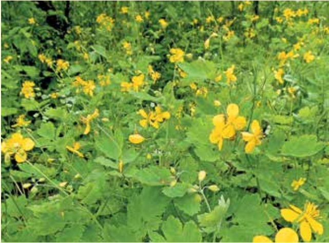
Галявина квітучого чистотілу великого у дендропарку "Перемога" с. Ходаки

А-2. Пухлини: меланома, аденокарцинома (у т.ч. молочної залози), пухлини яєчників, простати, сечостатевого шляху, печінки, ендометрія, і т.ін.