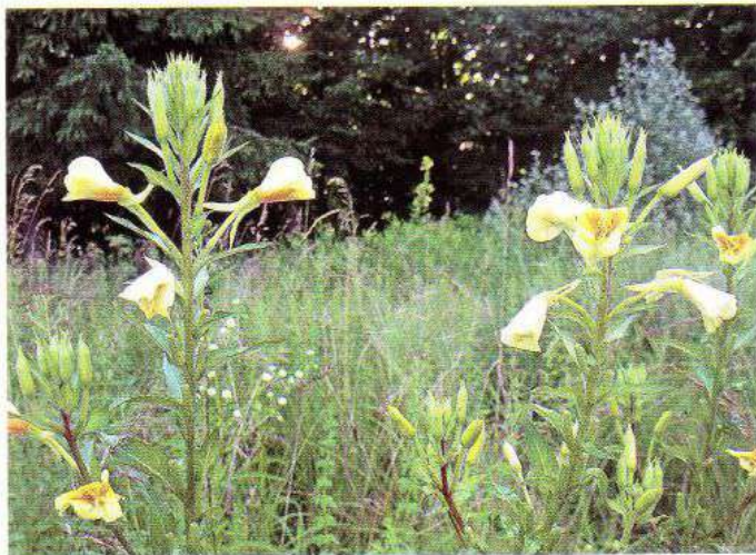
Квітує Енотера на полях дендропарку «Перемога» в с. Ходаки