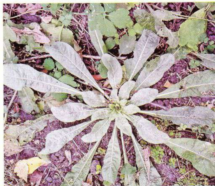
Розетка Енотери в перший рік життя