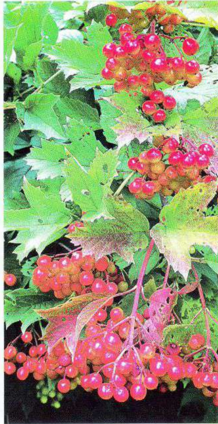
Плоди калини на різній стадії стиглості