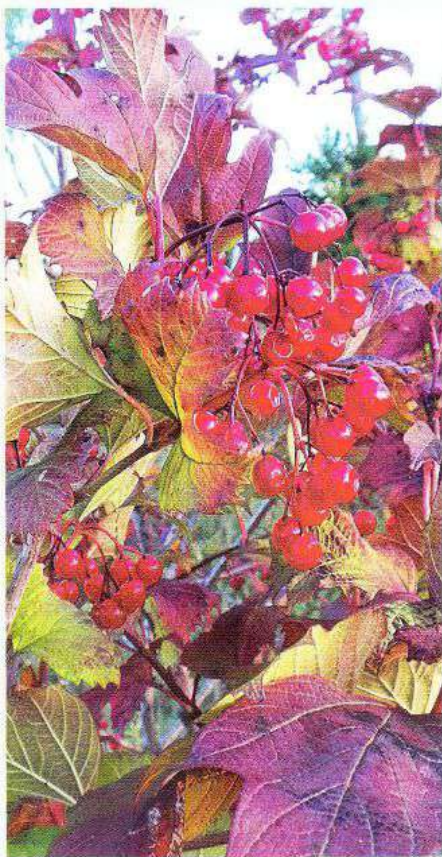
Стиглі плоди калини

нувато-сірого кольору, легко ламається і тоді видно червонуватий колір її внутрішнього шару.