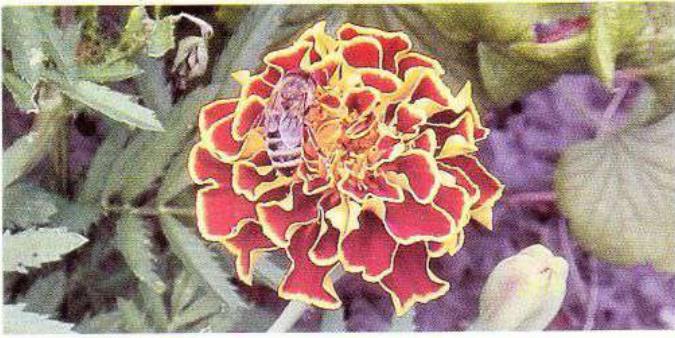
Бджола на квітці чорнобривців