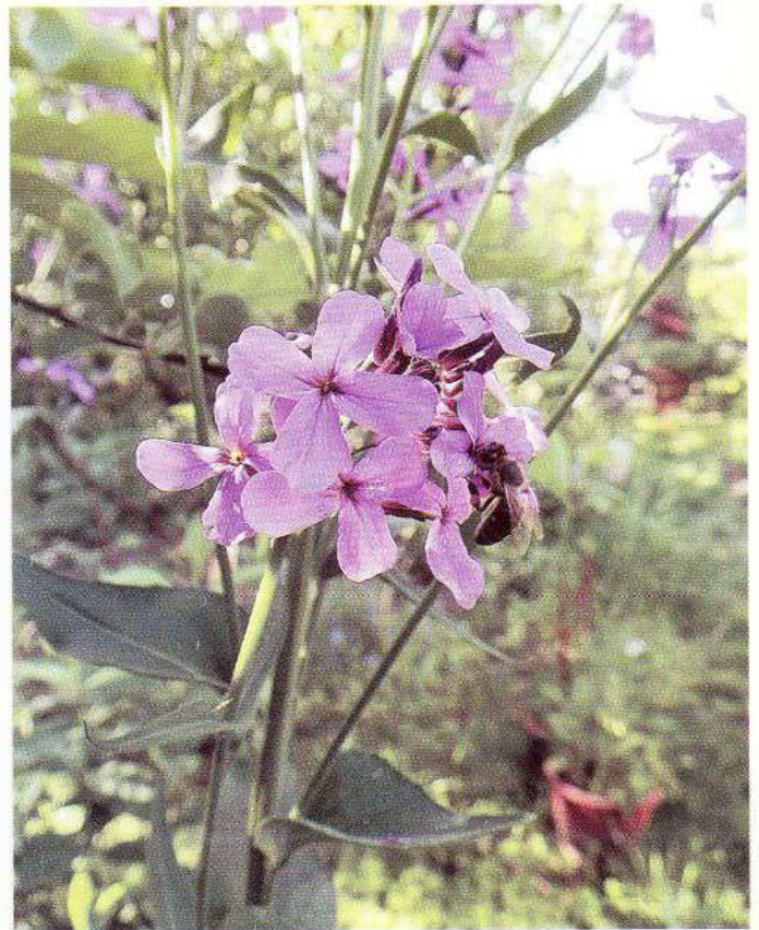
Бджола на квітці нічної фіалки