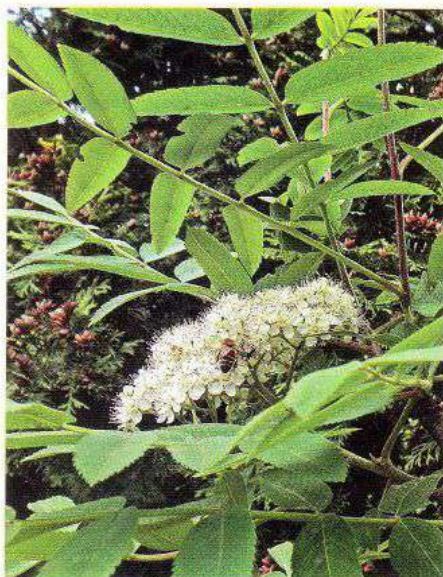
Квітує горобина в дендропарку «Перемога»

Розмноження. Горобину розмножують насінням, яке